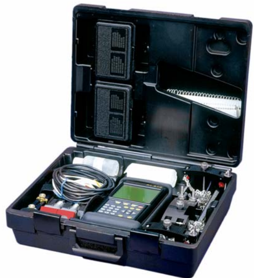
PT878便携式气体流量计系统及便携箱

即使是第一次使用，也可以在几分钟之内就完成测量——PT878流量计就是这么使用方便。只需输入现场参数、把传感器夹装在管外并调好声程。无需其它辅助工具，也无需管线上开孔。使用熟练的人可在一天内进行数十次完全不同的测试。PT878流量计是流量检测的理想选择。