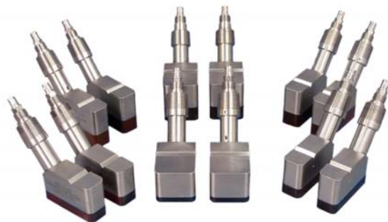
系列夹装式气体超声波探头